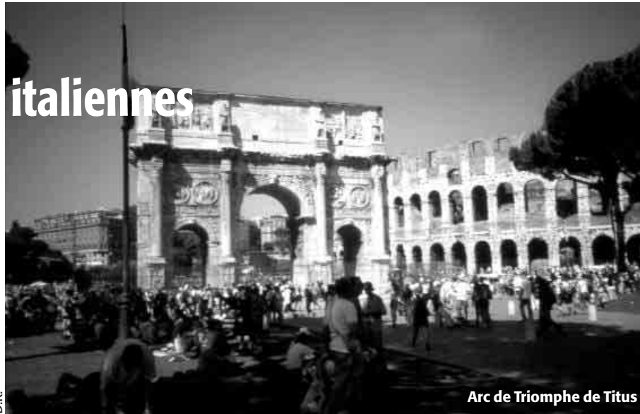
Arc de Triomphe de Titus

Il n'en faut pas plus pour que Berlusconi refuse sa défaite, exige le recomptage des votes, et accuse Prodi d'avoir manipulé les résultats. Ce n'est que le 19 avril que la Cour de cassation confirmera définitivement la victoire de la coalition de gauche. Mais "Il Cavaliere" est plutôt mauvais perdant et va dès lors tout faire pour perturber l'élection des présidents des deux assemblées parlementaires. À la Chambre des représentants, il commence par refuser catégoriquement la candidature de l'ex-communiste Massimo D'Alema, pour finir par accepter du bout des lèvres celle de Fausto Bertinotti... un néo-communiste! Au Sénat, les débats furent encore plus longs et houleux, avant que le catholique modéré Franco Marini ne s'impose de justesse.