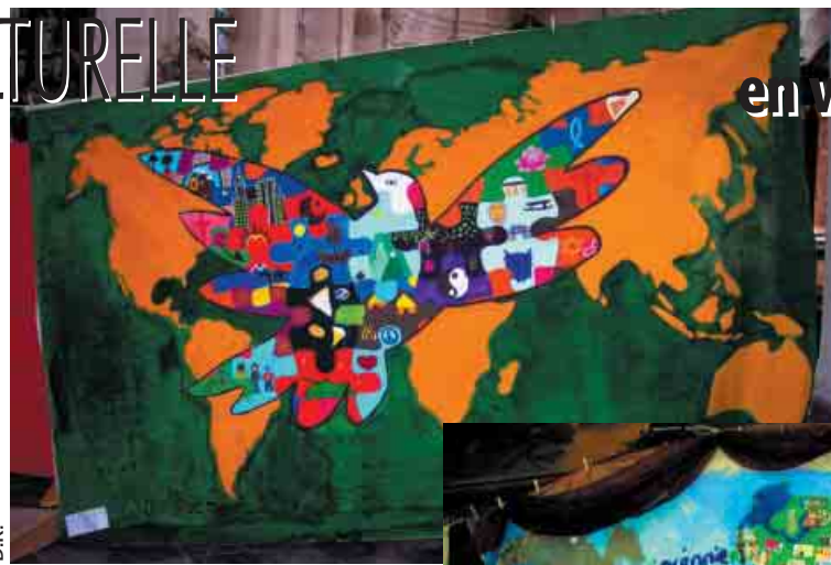
La fresque de "Jeunes avec Jésus" de Ferrière: la paix dans la diversité

Le concours organisé par Entraide et Fraternité s'intitulait "Fresque tu veux". Lancé au début de cette année, il s'inscrivait dans la campagne "Exister, Résister" menée sur les droits culturels. Les organisateurs suggéraient aux jeunes de réaliser en groupes une fresque sur tissu pour illustrer ce que leur inspire le mot culture, ce qu'ils ressentent face à la diversité culturelle et aux droits culturels dans le contexte de la mondialisation.