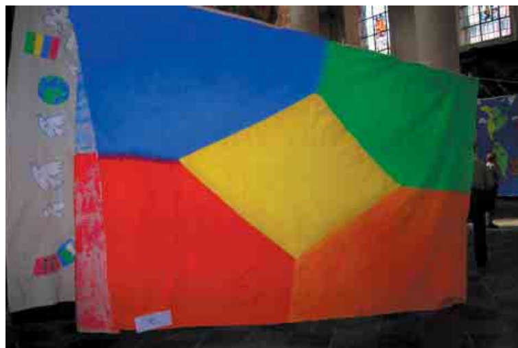
Art abstrait pour le collège St-Hadelin de Visé

On peut voir les photos de toutes les fresques participantes en se rendant sur le site d'Entraide et Fraternité: www.entraide.be