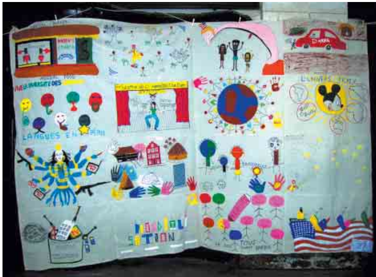
Le patchwork de l'athénée Bara de Tournai